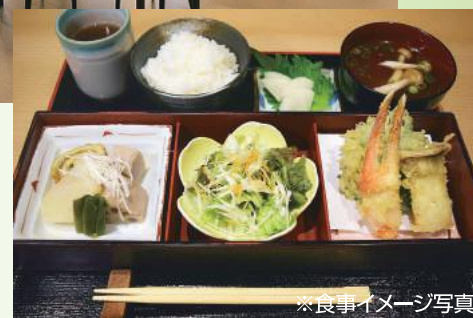
※食事イメージ写真

2方向から陽射しが入る、明るく開放感いっぱいの食堂では、様々なメニューの食事が楽しめます。季節の行事に合わせた特別メニューも多彩に用意しています。