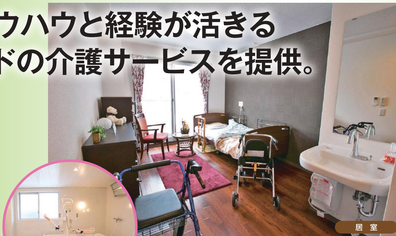
居室 日差しがあふれ、明るい居室。ベッド横にもナースコールが設置され、緊急時に備えています。

ご入居者様お一人お一人のこれまでの人生の中で築きあげたたくさんの歴史や個性を大切に…。医療・看護・介護の連携による心身面のサポートはもちろんのこと、「暮らし」に「安心」を提供致します。また、併設デイサービスでは開放的な大きな窓があり、気持ちの良い一日を過ごして頂けます。